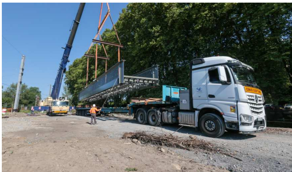
Fabriquées à Bagnac-sur-Celé (Lot), les passerelles ont été acheminées par des convois exceptionnels.