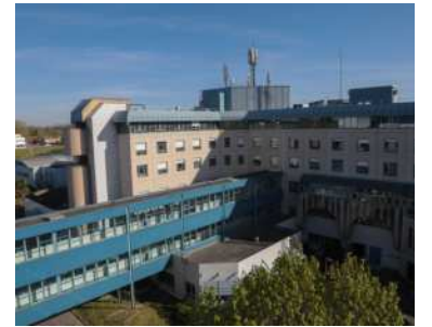
Près de 3 000 personnes travaillent à l'hôpital de Pau.

Le centre hospitalier de Pau, qui emploie près de 3 000 personnes dont 2 000 soignants, annonce la mise en œuvre de « sa nouvelle politique d'attractivité et de fidélisation des professionnels, ciblée sur les métiers en tension. » Ces nouvelles mesures sont mises en place afin d'améliorer les conditions de recrutement