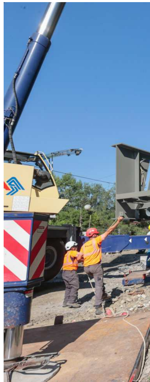
Les techniciens manœuvrent l'une des passerelles

C'est donc l'entreprise Matière basée à Arpajon-sur-Cère (Cantal) qui a été sélectionnée pour fournir les passerelles. Ces ouvrages en acier ont été fabriqués et assemblés dans l'usine de Bagnac-sur-Célé (Lot), l'un des cinq sites de production de cette société. De la conception à la livraison, ils ont nécessité en-