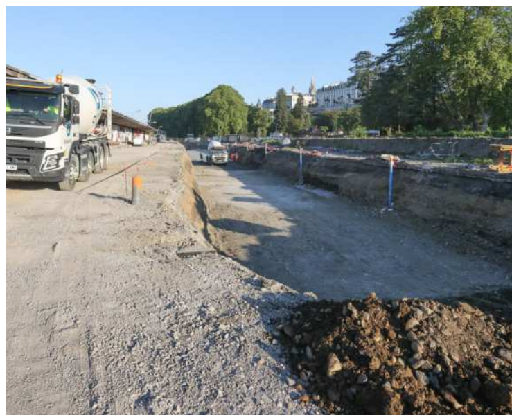
Un bassin de rétention est en cours d'aménagement devant la gare.

Devant la gare, une impressionnante tranchée a été creusée. Non, il ne s'agit pas d'initier une ligne ferroviaire souterraine, mais d'aménager un futur bassin de rétention qui sera ensuite recouvert par la chaussée. Ce canal doit encore être élargi de 3 mètres une fois l'opération des passerelles terminée, prévient l'un des responsables du chantier. Des cadres préfabriqués viendront ensuite prendre place au fond de la cavité. Ces équipements auront ensuite pour mission de récupérer les eaux pluviales lors des intempéries afin de ne pas surcharger le réseau d'évacuation.