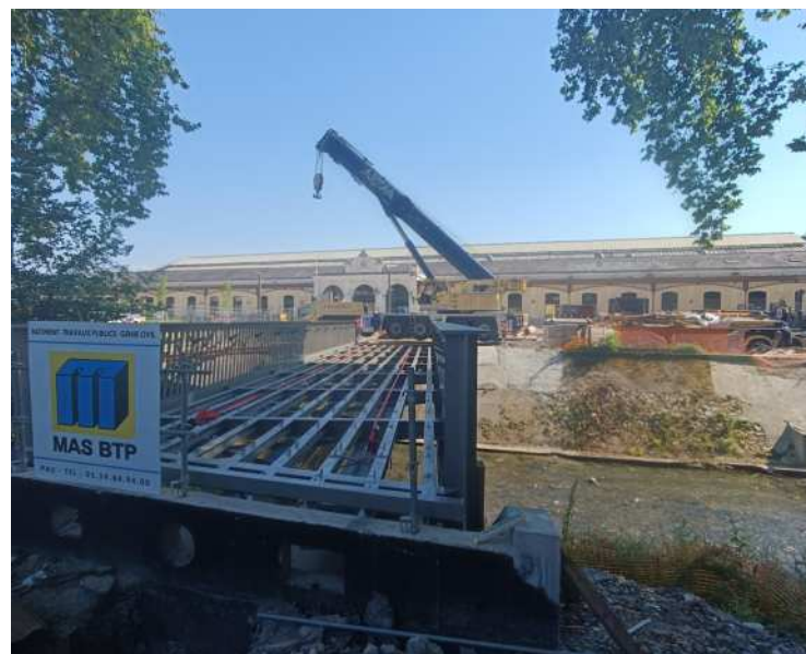
La passerelle devant la gare fait transiter les différents réseaux.

« CES PASSERELLES ÉTAIENT TRÈS ATTENDUES SUR UN PLAN ORGANISATIONNEL »