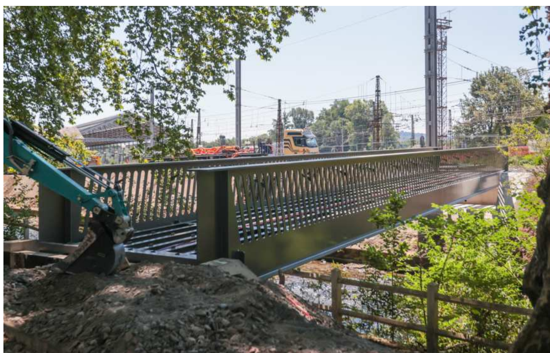
L'une des passerelles fera la liaison entre le parking du Stadium et la gare.