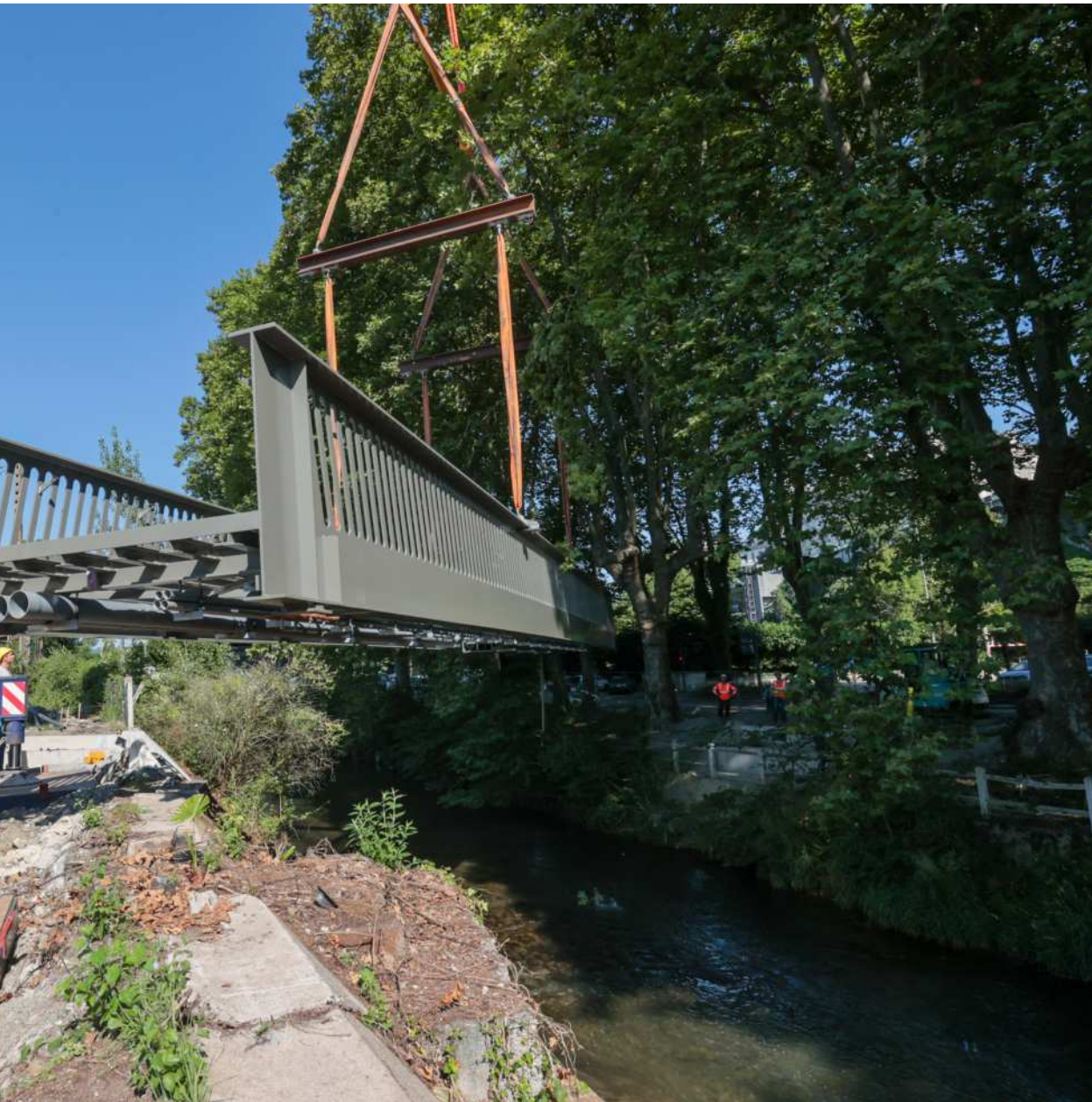
au-dessus de l'Ousse avant de procéder à son installation.